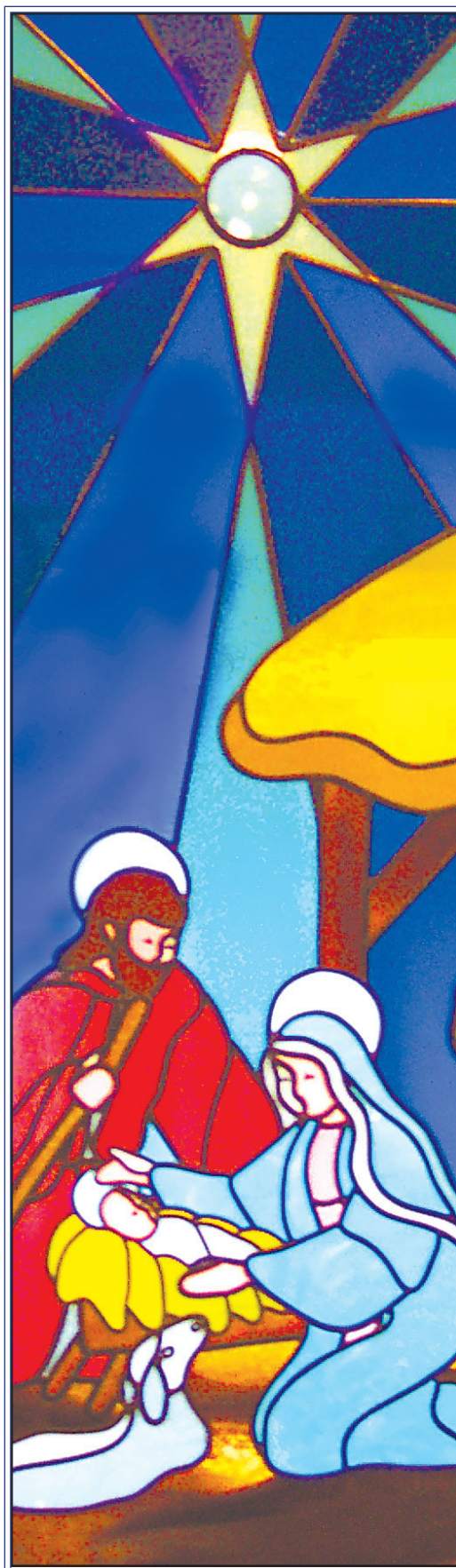
Stained glass window from Our Lady of Perpetual Help, Harrison